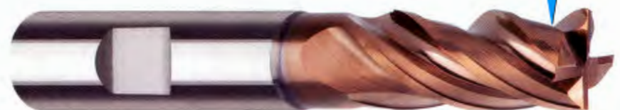
Die Fräseriesie „FightMax INOX“ ist eine Empfehlung aus „First Choice Inovatools“.

Beim „FightMax INOX“ setzt Inovatools auf spezielles Ultrafeinstkorn-Hartmetall in ausgewogenem Mischungsverhältnis. Das Werkzeug hat eine ungleich geteilte und ungleich gedrehte Geometrie mit hoch polierten Spanräumen. Das gibt dem Werkzeug die nötige Performance, sorgt für einen ruhigen schwingungsfreien Rundlauf und gewährleistet die schnelle sowie prozesssichere Spanabfuhr. Unterstützt wird dies durch die glatte Hochleis-