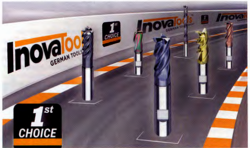
Mit „First Choice Inovatools“ vereinfachen die Kindinger Werkzeugspezialisten das schnelle Identifizieren des maßgeschneiderten Werkzeugs für die kundenspezifische Zerspananforderung.

„Um bei der Suche zum anwendungsoptimierten Werkzeug schnell zum Ziel zu kommen, hat Inovatools eine Vorauswahl an Top-Produkten getroffen und als besondere Empfehlung gekennzeichnet,“ so Tobias Eckerle, Produkt-