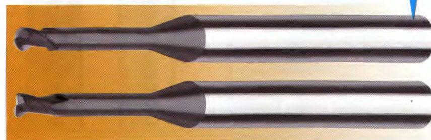
Edition Diamant HQ-Linie: Unten, VHM-Schaftfräser mit Eckenradius, 2 Zähne. Oben: VHM-Schaftfräser mit Vollradius, 2 Zähne.

Diamantbeschichtete Hartmetallwerkzeuge sind die ideale Lösung, um abrasive Werkstoffe wie etwa Graphit und Composites wirtschaftlich zu bearbeiten.